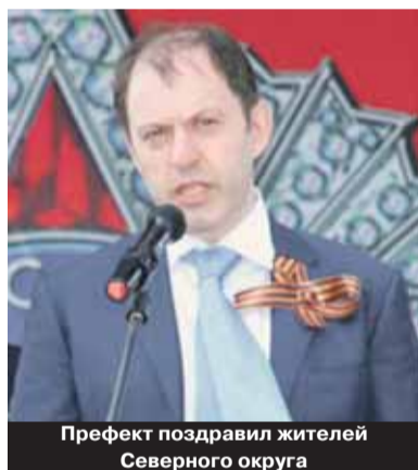
Префект поздравил жителей Северного округа

Свыше тысячи праздничных мероприятий, посвященных 65-й годовщине Победы в Великой Отечественной войне, прошло в Северном административном округе. Их зрителями и участниками стали около 500 тысяч москвичей.