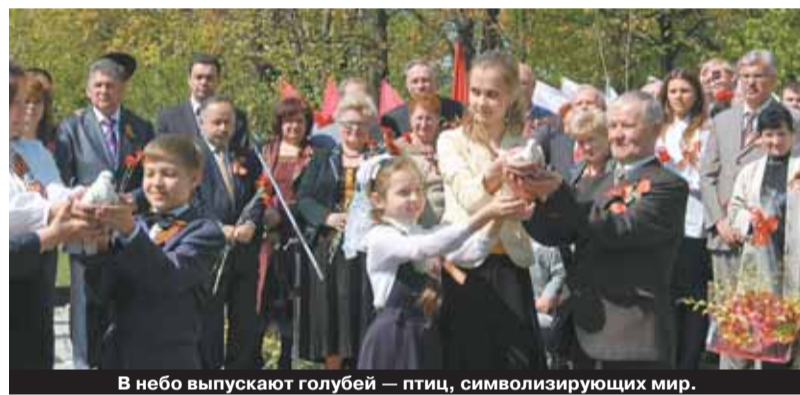
В небо выпускают голубей — птиц, символизирующих мир.

щали родину с первых дней войны. Открывшийся монумент, представляющий собой гранитную двухметровую стелу, был освящен священником Дмитрием, клириком