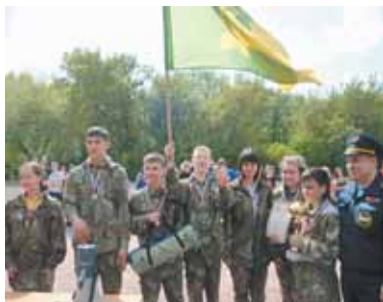
10 и 11 мая на базе школы № 1250 (район Войковский) прошли XII окружные соревнования «Школа безопасности» между учащимися образовательных учреждений САО.

Целью этих ежегодных состязаний является приобретение и закрепление практических навыков школьников в чрезвычайных ситуациях природного, техногенного и экологического характера.