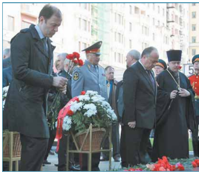
7 мая префект САО Олег Митволь вместе с другими членами Правительства Москвы почтили память погибших в Великой Отечественной войне и возложили цветы к Могиле Неизвестного солдата и памятнику маршалу Жукову на Красной площади.