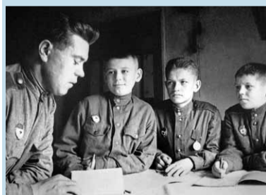
Фото из семейного альбома