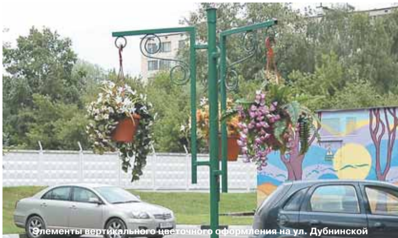
Элементы вертикального цветочного оформления на ул. Дубнинской

Около 40 тысяч квадратных метров цветников будет организовано в Северном округе столицы нынешним летом.