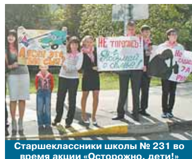
Старшеклассники школы № 231 во время акции «Осторожно, дети!»

В Северном округе проходит общегородской рейд ГИБДД «Снова в школу»