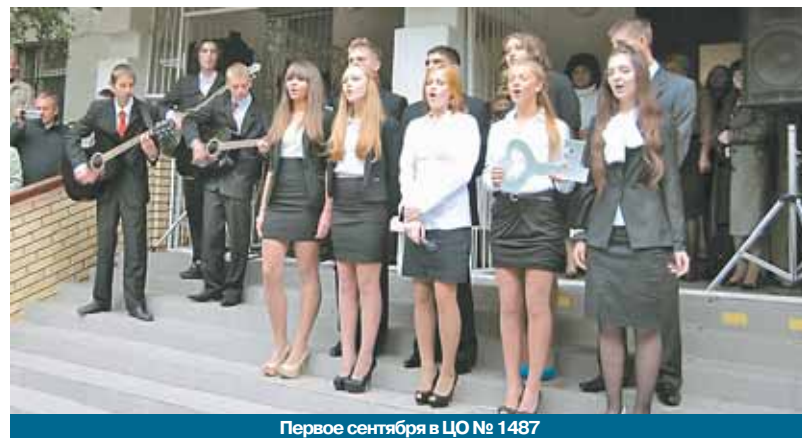
Первое сентября в ЦО № 1487