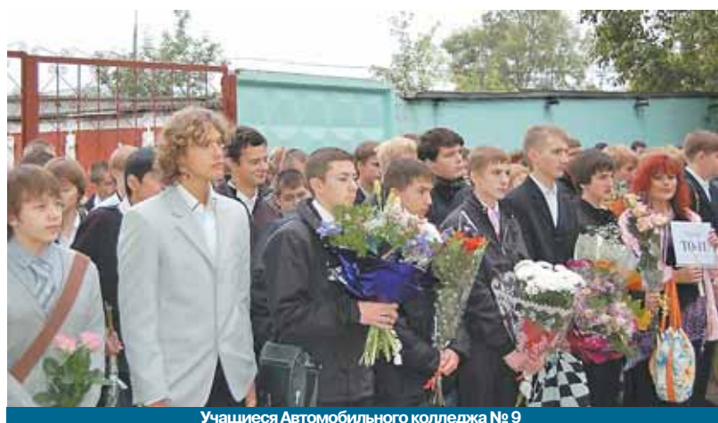
Учащиеся Автомобильного колледжа № 9

Поздравить ребят и преподавателей с началом учебного года в