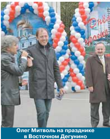
Олег Митволь на празднике в Восточном Дегунино

4 сентября префект САО Олег Митволь поздравил жителей округа с Днем города