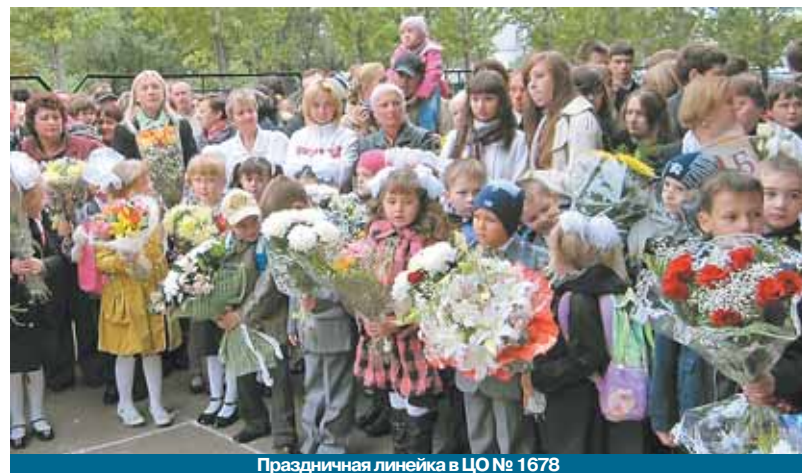
Праздничная линейка в ЦО № 1678

По результатам принятого решения будет определено дальнейшее использование данной территории.