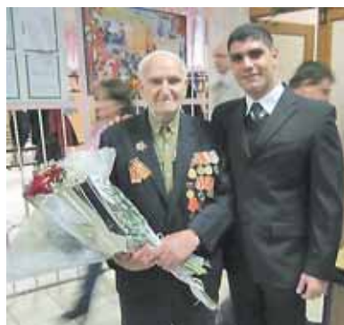
Первый урок, посвященный «Великим победам российского народа» во всех школах провели ветераны Великой Отечественной войны.

Яркие букеты цветов, белые пышные банты первоклассниц, волнение учеников и родителей и общее приподнятое праздничное настроение, царящее первого сентября в школьном дворе Центра образования № 1296, заряжало воздух и сердца гостей каким-то особенным, теплым, ностальгическим чувством по давно прошедшим школьным годам, а ребятам давало возможность порадоваться встрече с одноклассниками, любимой школой и учителями. По традиции в этот день звучало много поздравлений и теплых слов напутствия ученикам и педагогам.