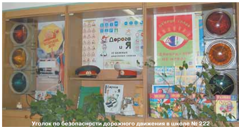
Уголок по безопасности дорожного движения в школе № 222

Отряд юных инспекторов дорожного движения действует в школе № 222.