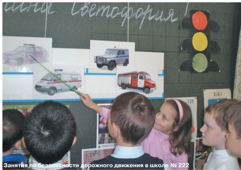
Занятия по безопасности дорожного движения в школе № 222

В-третьих — провоцирование ребенка на опрометчивый поступок самими взрослыми: переход дороги вне пешеходного перехо-