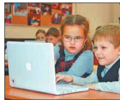
ные школы радушно встретили детвору 1 сентября.

В настоящее время продолжается мониторинг готовности школ к началу учебного года. Администрацией района, Северным окружным управлением образования и руководством учебных заведений предпринимаются все необходимые меры, чтобы обновлен-