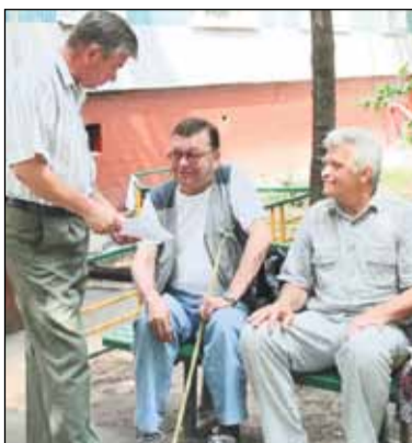
Окончание. Начало на стр. 3

Исполнительная и муниципальная власть, видя положительную сторону работы ОПОП в поддержании общественного порядка, стали ставить перед ними задачи, которые требуют вовлечения жителей