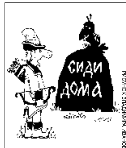
РИСУНОК ВЛАДИМИРА ИВАНОВА

Не забывайте: что мы сейчас поседем в детей, то потом и пожнем.