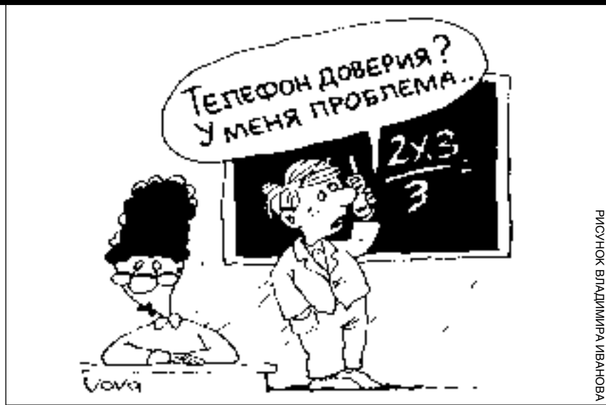
РИСУНОК ВЛАДИМИРА ИВАНОВА