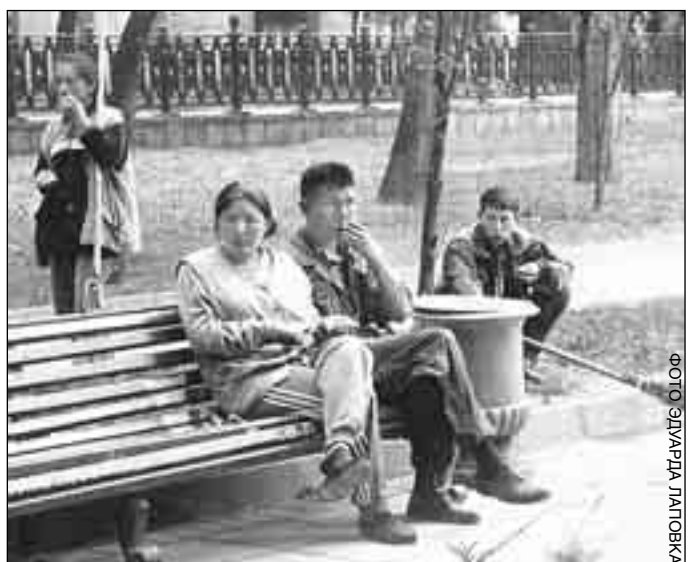
ФОТО УГАЛИЧЕ ОЛОФ

реля, когда закончился период формирования подразделения, проведено около 300 режимно-профилактических мероприятий с привлечением сотрудников ГУВД, ФСБ, представителей местных органов самоуправления и общественной помощи. Проверено 949 предприятий и организаций. В бюджет по итогам проверок и выявленных нарушений законодательства в виде штрафов и других взысканий перечислено более миллиона рублей. За нарушения паспортно-визовых правил привлечено к ответственности 408 тысяч человек, оштрафовано 367 тысяч, а 6 тысяч граждан по решению суда были выдворены за пределы Российской Федерации.