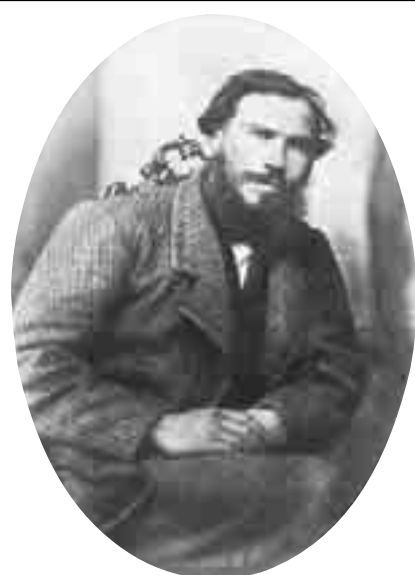
Л.Н. Толстой. 1862 г.

В Ясной Поляне я побывала незадолго до юбилея Льва Толстого. Ничто предстоящих торжеств здесь не предвещало. Никакой предпраздничной суеты. Стайки детей шли на экскурсию, рабочие ремонтировали мостик. Покрытые гравием дорожки, барский белый дом, за ним пасаека... И все та же, растворенная, кажется, в самом яснополянском воздухе, аура покоя.