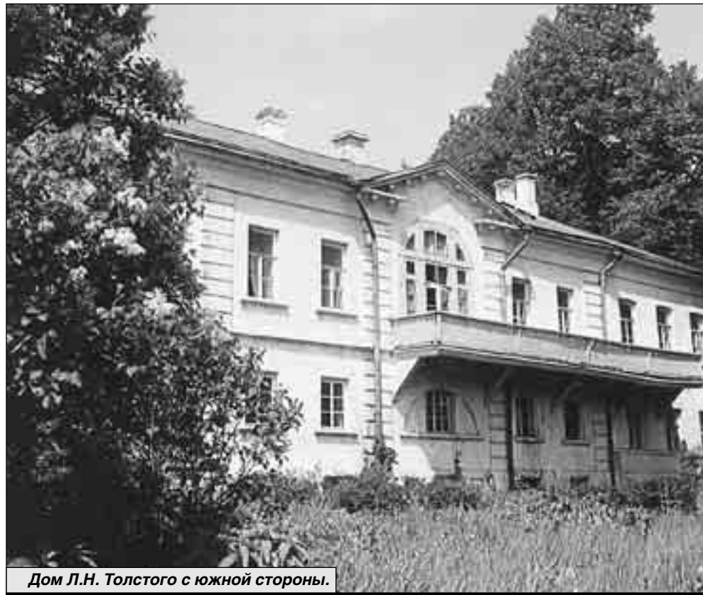
Дом Л.Н. Толстого с южной стороны.