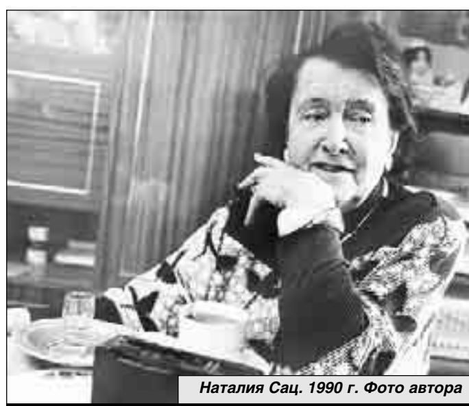
Наталия Сац. 1990 г.

Первый и долгое время единственный в мире профессиональный музыкальный театр для детей открылся 21 ноября 1965 года в центре Москвы, на улице 25-го Октября, ныне Никольской. Ей 62, ее слава вновь приобретает международный масштаб - детские музыкальные театры начинают открываться