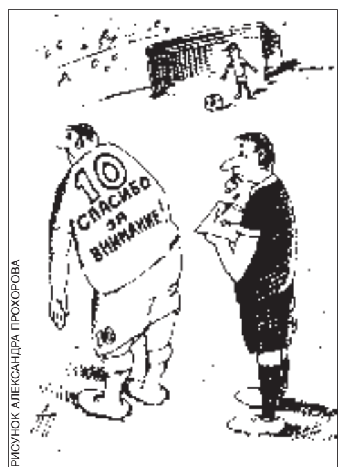
РИСУНОК АЛЕКСАНДРА ПРОХОРОВА