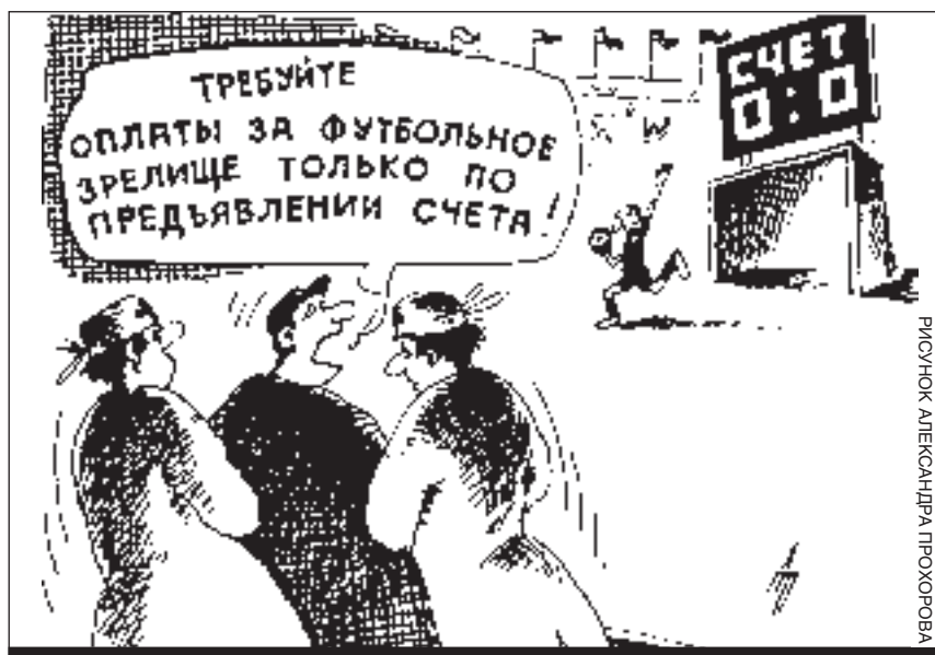
РИСУНОК АЛЕКСАНДРА ПРОХОРОВА

вызвало законную гордость городского руководства - можем ведь, значит, жить по-людски, елки-молалки! Правда, футбольный мяч круглый и может еще полететь куда угодно. Но главное-то произошло: мы поверили, что человек - мячу хозяин, а не ветер, который раньше почему-то всегда был для соперников попутный, а для нас - встречный. И надо бы закрепить эту веру, раз она так помогает нам жить!