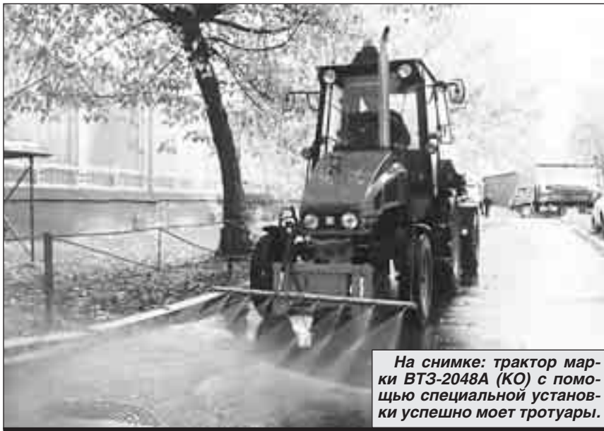
На снимке: трактор марки ВТЗ-2048А (КО) с помощью специальной установки успешно моет тротуары.

- Из существующих отечественных тракторов владимирский трактор ВТЗ-2048А в коммунальном исполнении наиболее полно отвечает требованиям, предъявляемым к машинам, предназначенным для уборки тротуаров и дворов, - сказал он. - В своем классе - шириной захвата 1,4 - 1,6 метра - эти тракторы наиболее универсальны. Если они оснащены комплектом всепогодного уборочного оборудования, их смело можно рекомендовать коммунальным организациям Москвы и других городов России. У них от-