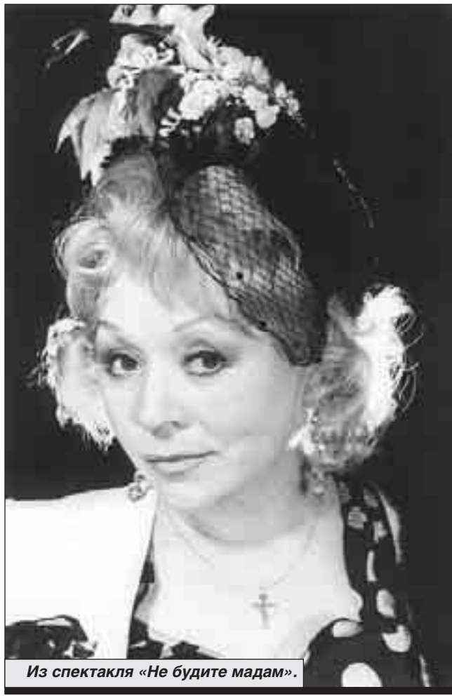
Из спектакля «Не будьте мадам».

Во всяком случае, я бы очень могла правительству города. Оно просто не знает, кого еще из одиночных мысленников надо привлечь в свои ряды. Я дворник-любитель не только в своем дворе, но и в парке, театре. Когда гуляю по нашему парку и вижу мусор, какой-то непоря-