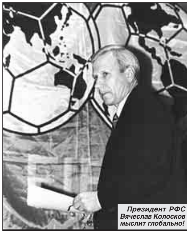
Президент РФС Вячеслав Колосков мыслит глобально!

Устав РФС по-своему очень любопытен: согласно ему футбольные клубы страны (только вдумайтесь!) не являются членами организации. И какие-нибудь 80 чиновников из региональных федераций будут вершить судьбы отечественного футбола, выбрав