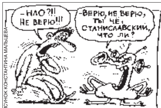
РИСУНОК КОНСТАНТИНА МАЛЫШЕВА

■ Выдавил из себя раба - держись от него подальше.