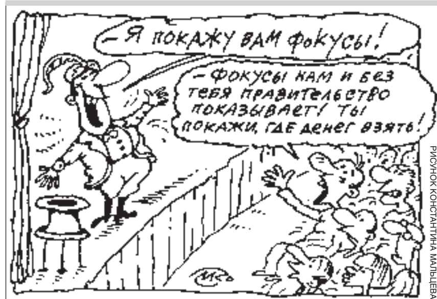
РИСУНОК КОНСТАНТИНА МАЛЫШЕВА