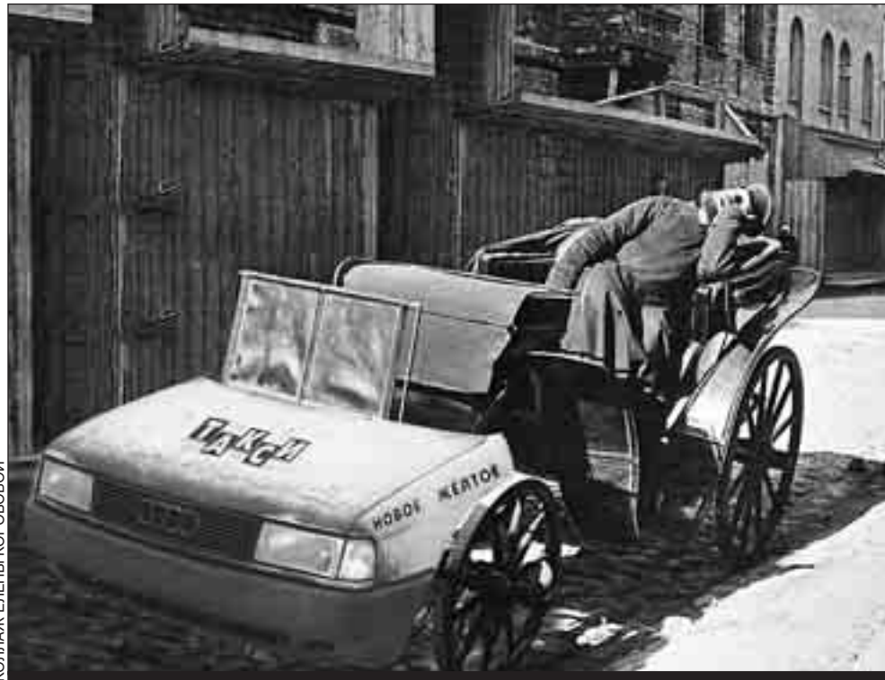
КОЛЛАЖ ЕЛЕНЬИ КОРГОВОЙ

Публика часто по собственной воле принимала навязанные правила игры. Там, где ванька возил за четвертак-двугривенный, лихач обычно брал «синенькую» - 5 рублей. Лихачей снимали люди, привыкшие сорить деньгами. Или те, кто хотел пустить