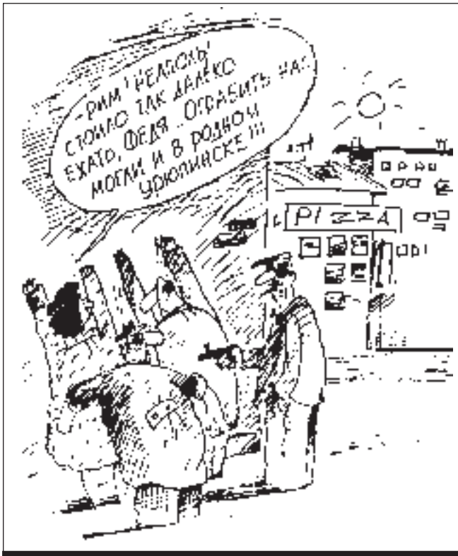
РИСУНОК МИХАИЛА ЛЯРЧЕНОВА

...Через месяц я возвращался из отпуска домой. Улетел с того же Центрального аэровокзала. До регистрации оставалось полчаса. Я вышел на улицу, достал сигареты и... столкнулся нос к носу с той самой рыжей подругой «потерпевшей». Она как ни в чем не бывало обратилась ко мне с просьбой: «Мужчина, угостите покурить». Задумав, отошла и стала внимательно наблюдать за стоянкой такси. А там... билась в истерике все та же старая знакомая - несчастная женщина с ребенком на руках. Рыдая на всю округу, она голосила о потерянном кошельке.