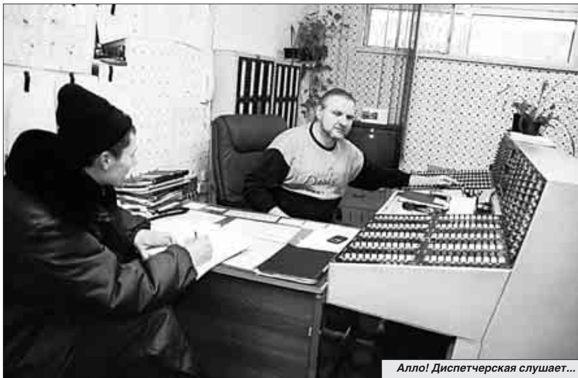
Алло! Диспетчерская слушает...