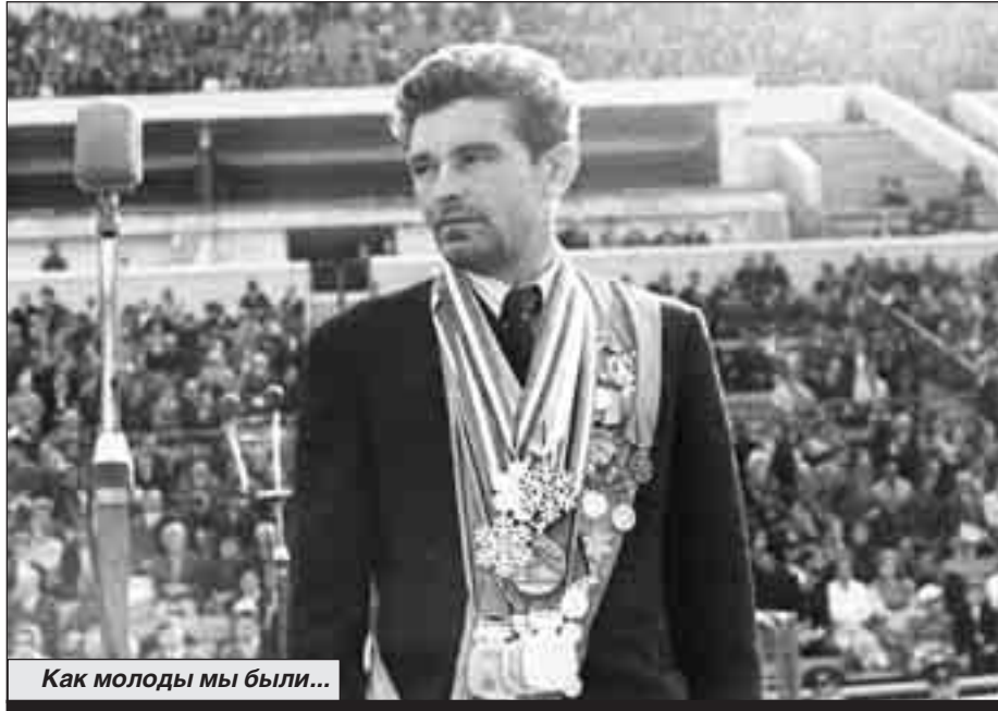
Как молоды мы были...

другой семье, учатся, скажем, до трех-четырёх дня. Дальше темно на улице по банальной причине: зимой деньки короткие. И в будни сыновьям тренироваться негде, можете себе представить: в лесу, на трассе сплошная мгла. В столь незавидном положении находятся десятки тысяч ребят и девчат, мечтающих приобщиться к лыжному спорту.