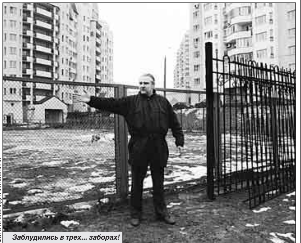
Заблудились в трех... заборах!