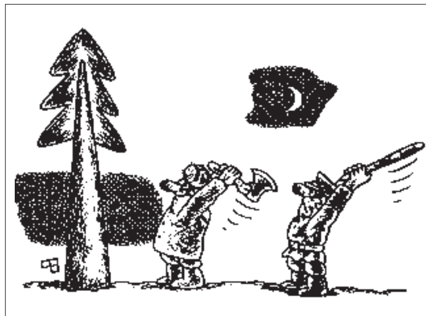
РИСУНОК ВИКТОРА ФЕДОРОВА

Танцевали. Пошли гулять. Пускали в небо. Дурачились. Замерзли. Вернулись. Разлили. Согрелись. Снова танцевали. Устали. Простылись. Разошлись. Встретились утром. Продолжать... С Новым годом! С новым счастьем!!!