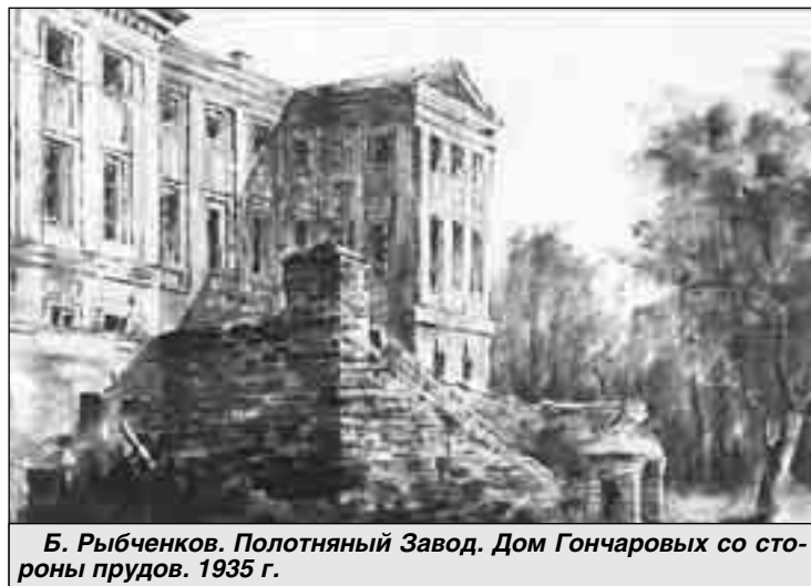
Б. Рыбченков. Полотняный Завод. Дом Гончаровых со стороны прудов. 1935 г.

На выставке «Чувство времени» в Мемориальной квартире Андрея Белого на Арбате, организованной галереей «Ковчег», демонстрируются живописные и графические работы Бориса Рыбченкова и Чеслава Стефаньского.