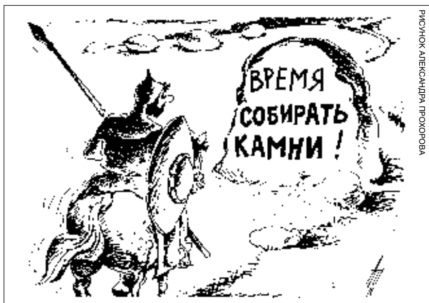
РИСУНОК АЛЕКСАНДРА ПРОХОРОВА