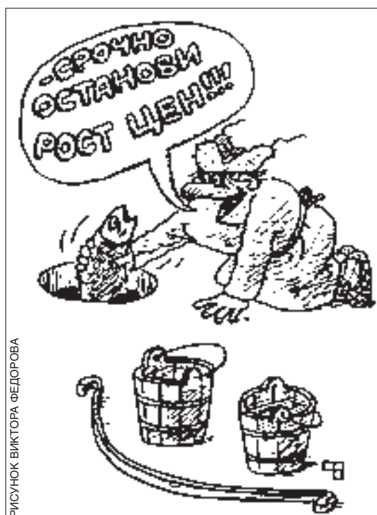
РИСУНОК ВИКТОРА ФЕДОРОВА

Словом, обалдуевцы размышляют: а что такое, собственно, деньги? С чем их едят? И кто ест их? Поскольку «деньги» - понятие, вроде бы и простое, но на самом деле весьма сложное и малоизученное. Да и попробуй изучить деньги, если их никогда нет!..