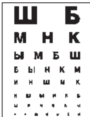
через 3-5 месяцев тренировок

дали известные ученые, а к производству и применению в медицинской практике "Супер-Вижн" рекомендовала одна из ведущих офтальмологических клиник.