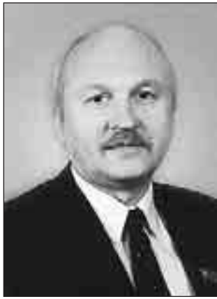
ДОМА НЕОТВРАТИМО СТАРЕЮТ

Как-то - я работал в Мосгордуме - мне задали простенький вопрос: «Какие законодательные инициативы в сфере ЖКХ были у московского законодательного органа в 2003 году?» И я задумался. Не вспомнил - не было таких инициатив. Разве что подготовлена программа развития жилищно-коммунального хозяйства города, но так и не принята, даже не вынесена на обсуждение. Реформа, по сути, стоит.