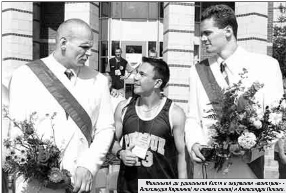
Маленький да удаленький Костя в окружении «монстров» - Александра Карелина (на снимке слева) и Александра Попова.

- Так здорово быть в Москве, пообщаться с вами, друзьями! Родственников наконец обниму, они специально приехали из Ульяновска повидаться со мной, - начал свой разговор с корреспондентом «МС» знаменитый боксер Костя Цзю. - Знаете, о чем мечтаю? Спуститься в метро, потолкаться в толпе, застрять в пробке, чтобы уж сполна поймать кайф, пощупать город изнутри. Я ведь в долгу перед ним, но потерпите - верну его.