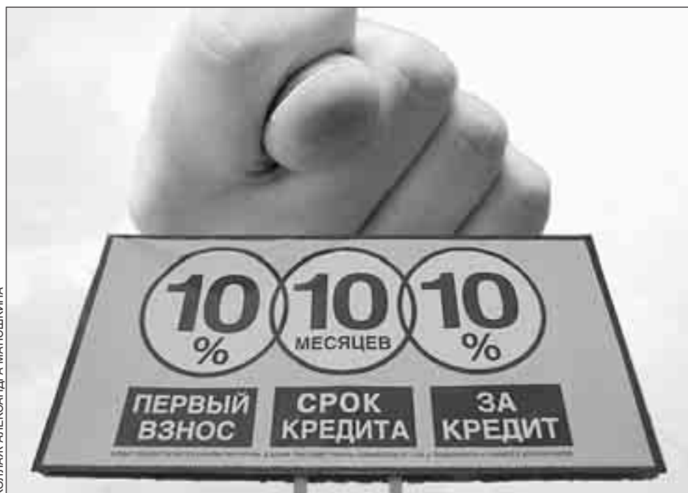
КОЛЛАЖ АЛЕКСАНДРА МАТЮШКИНА

А каковы условия кредитования? Практически во всех банках для получения кредита мужчине должно быть от 23 до 65 лет. Женщины почему-то считаются более надежными в молодом возрасте: они получают кредит уже в 21 год. Необходимо также наличие гражданства РФ и постоянной прописки в Москве или Московской области. Дальше начинаются небольшие различия.