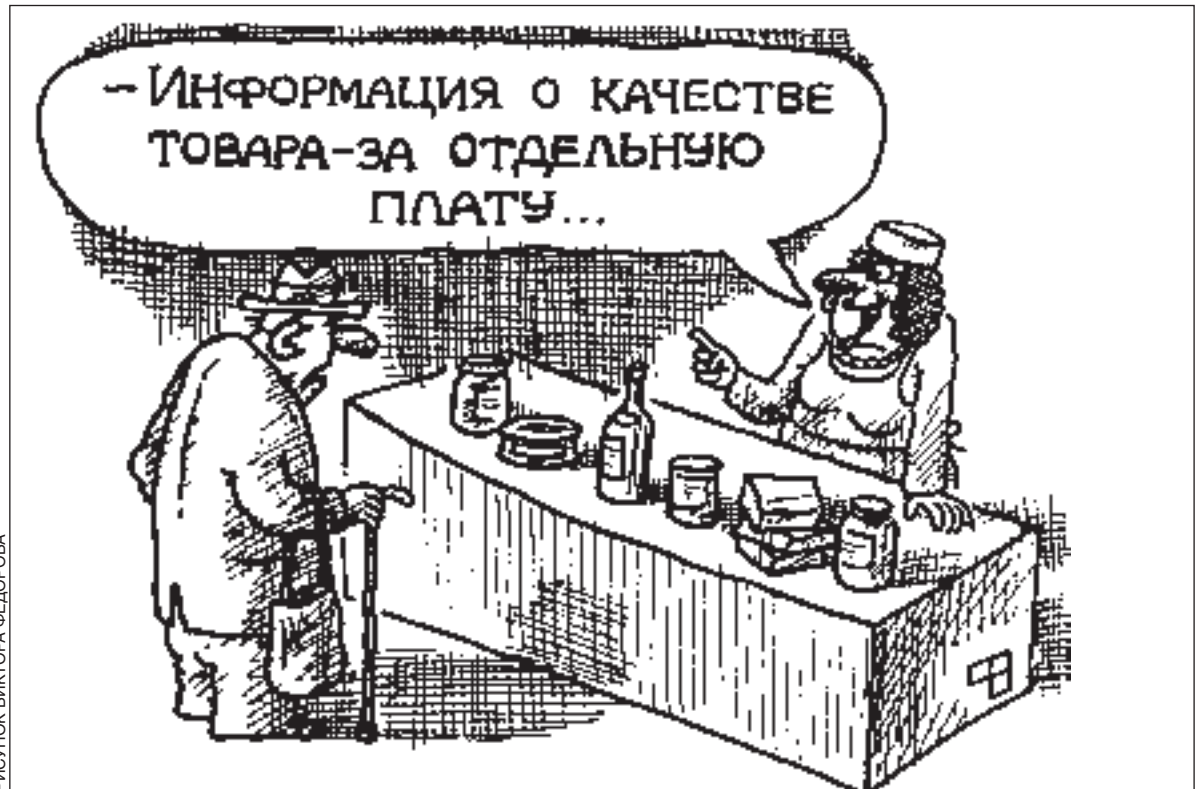
РИСУНОК ВИКТОРА ФЕДОРОВА