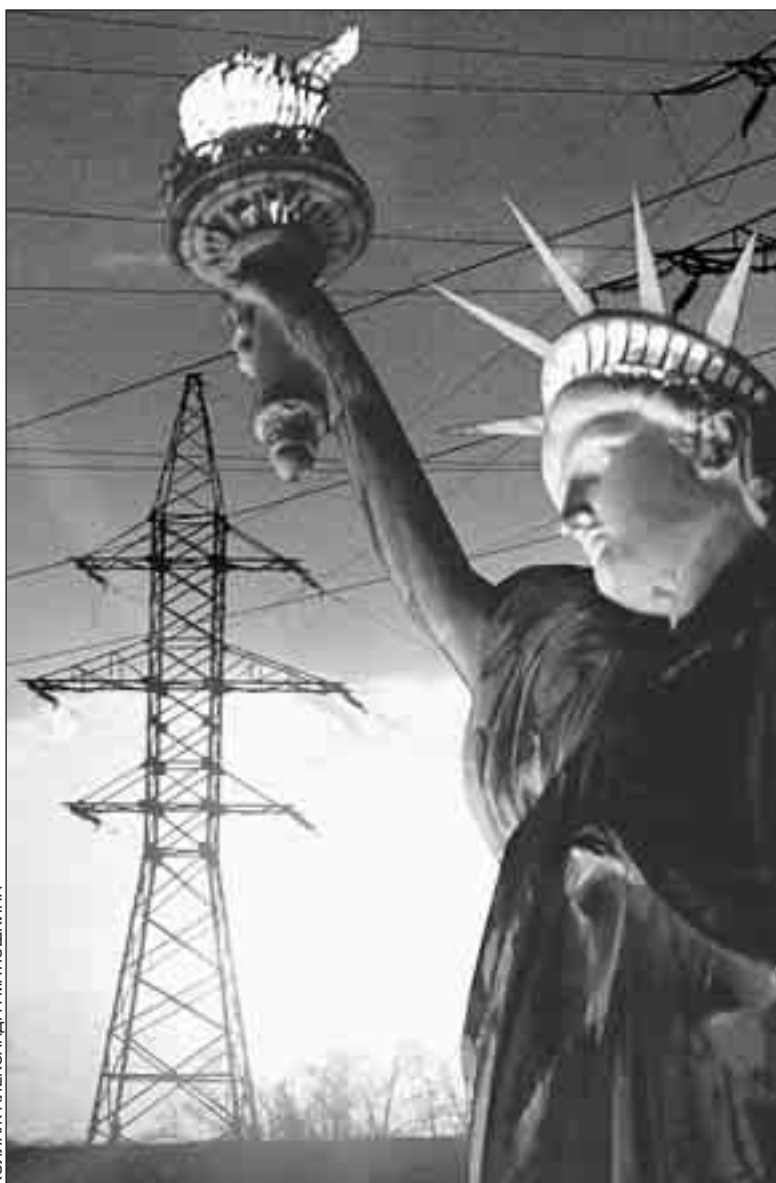
КОПЛАЖ АЛЕКСАНДРА МАТЮШКИНА

«на глазах у всех происходит знакомая до боли история - из-за межпартийной и региональной грызни конгресс оказывается не в состоянии разобраться и дать одобрение президентским идеям». И это при том, что катастрофа с подачей электроэнергии, вызванная августовским ураганом, была «объективно предотвратимой». Именно таков главный вывод, к которому пришла совместная американско-канадская комиссия по расследованию, несколько месяцев тщательно изучавшая все обстоятельства случившейся беды. Из-за плохой подготовки персонала, говорилось также в докладе следователей, «произошла цепная реакция коротких замыканий на линиях, что в конечном счете и привело к перегрузке уцелевших систем, которые в результате вышли из строя».