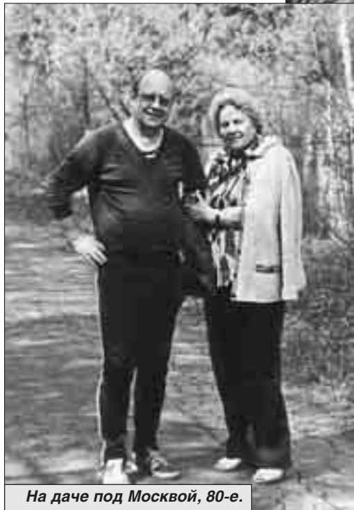
На даче под Москвой, 80-е.

- Все произошло случайно, в цепи совпадений. Я толком тогда Визбора не знал, но когда мы его посмотрели, он органично совпал с тем, что я задумал. В «Июльском дожде», например, замечательно исполнил песню Окуджавы «Простите пехоте».