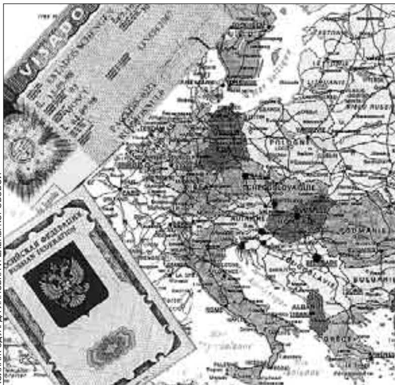
КОллаж: ЭДУАРДА ПАПОВА и ЕЛЕНА КОРОВОЙ

Но есть и другие районы. В Отрадном проживает до 160 тысяч человек. Там в паспортно-визовом отделении трудится 20 человек. И в такие отделения в день приходят по 40-50 человек. Естественно, что порой приходится подождать. Тем не менее очереди нет. Когда были межрайонные ОВИРы, люди съезжались с разных концов города - вот и появлялись «тромбы».