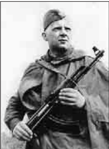
На военной службе. Под Кандалакшей, 1957 г. Надпись на обороте:

Вот я снова готов идти По ревущему, как прибой, По безжалостному пути До тебя и до встречи с тобой.