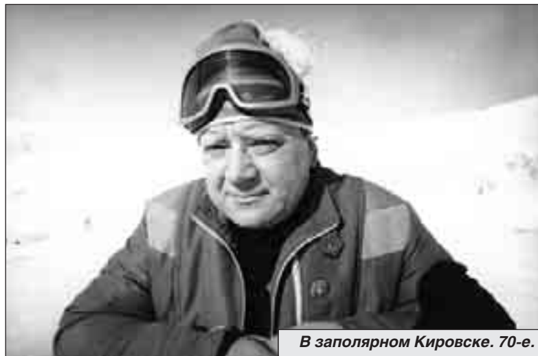
В заполярном Кировске. 70-е.

Большое видится на расстоянии. Отношение к Визбору у каждого свое, даже когда схлынула волна «визборомании». Мы ведь тоже этим грешили: в наши 60-е не зная, не подпевать Визбору было не comme-il-faute. Недавно я купил диск Визбора - и вдруг понял, что через столько лет все песни помню наизусть! Некоторые из них меня в свое время повернули - например, «Утренний рейс Ленинград - Москва»: я узрел внутренний мир поэта,