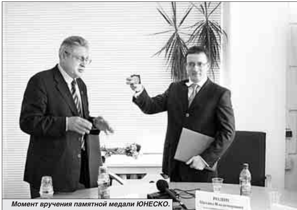
Момент вручения памятной медали ЮНЕСКО.

По моему убеждению, сейчас нужна государственная программа поддержки детской литературы. Потому что, как бы напыщенно это ни звучало, количество проданных книг определяет культурный уровень нации. От того, сумеем ли мы приучить своего ребенка к чтению, зависит наше будущее.