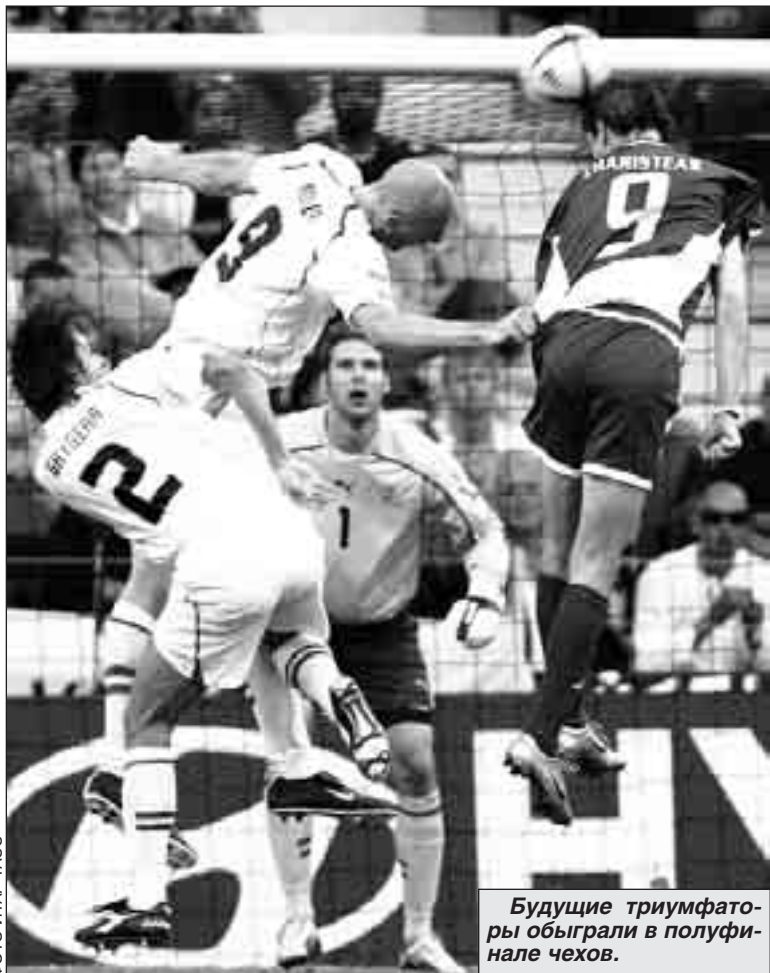
Будущие триумфаторы обыграли в полуфинале чехов.

Все-таки выйти в финал с такой командой, как греческая... Нужно быть не просто хорошим, а гениальным тренером. Не удивлюсь, если тамшние ваятели соорудят памятники немцу Отто Рехагелю по всей Греции. Ибо спортивного подвига, подобного совершенному этим специалистом и его подопечными, трудно припомнить. Весьма средняя по европейским меркам команда без даже ярких личностей покорила тем не менее футбольную Европу. Своим характером, жадной игрой, неплохой техникой, отточенным тренерским мастерством. Безусловно, в составе греков есть мастера достаточно высокого уровня. Но до старта чемпионата их возможности представлялись ограниченными, разумеется, в сравнении со звездами первой величины из сборных Испании, Англии,