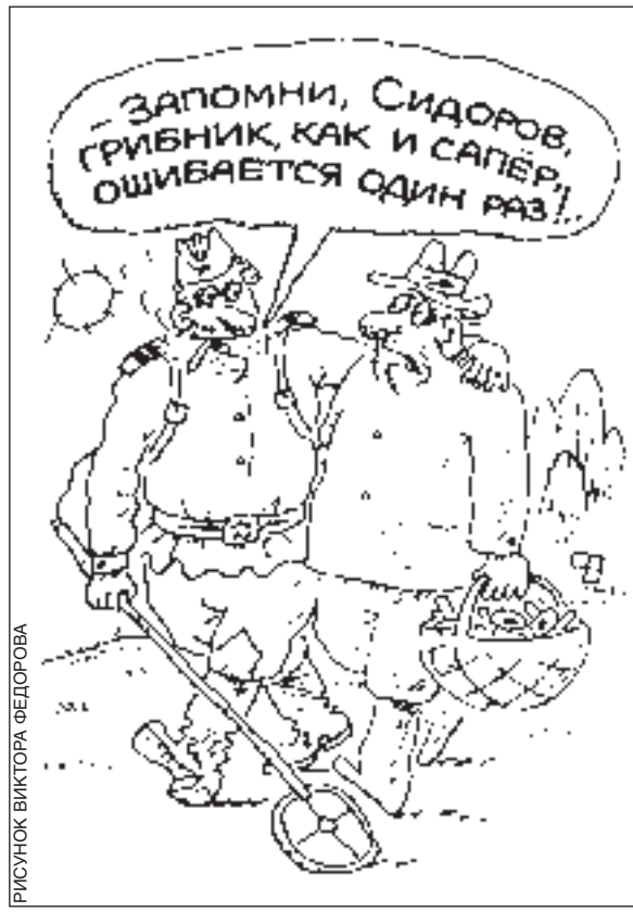
РИСУНОК ВИКТОРА ФЕДОРОВА