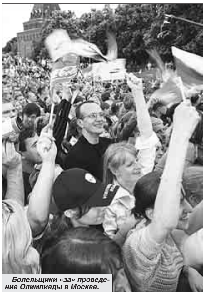
Болельщики «за» проведение Олимпиады в Москве.

Результаты еще трех встреч: «Ротор» - «Рубин» - 0:1, «Кубань» - «Динамо» - 0:0, «Сатурн» - «Амкар» - 1:1.