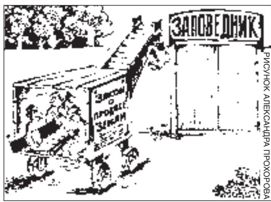
РИСУНОК АЛЕКСАНДРА ПРОКОПОВА