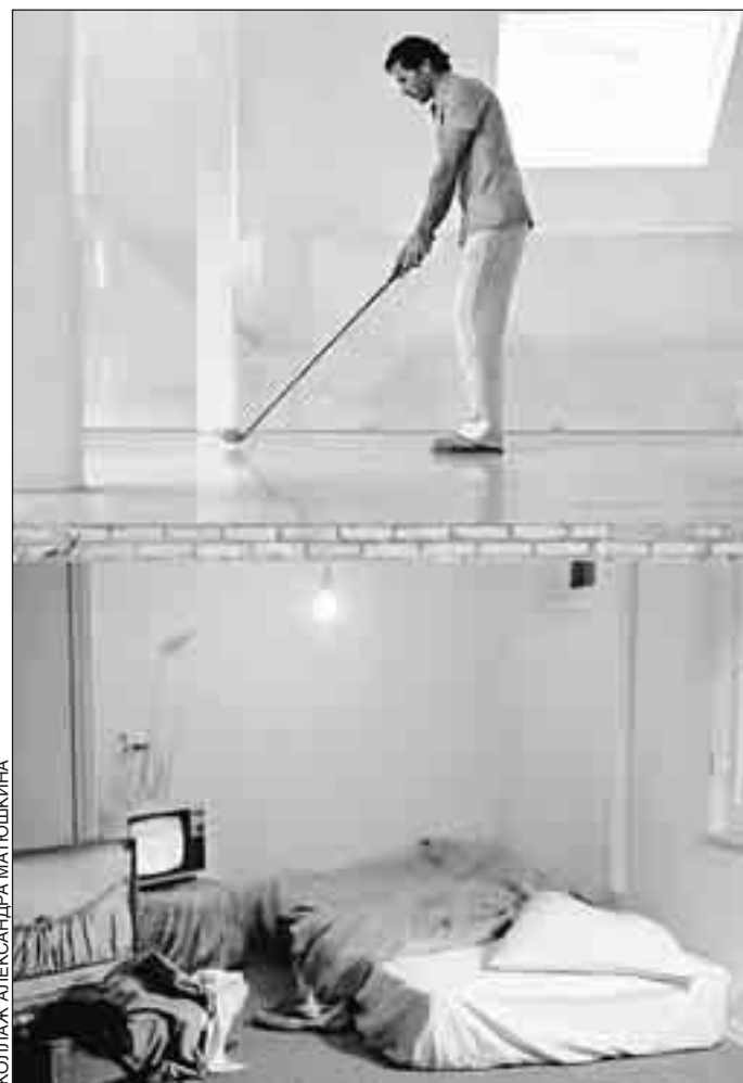
КОЛЛАЖ АЛЕКСАНДРА МАТЮШКИНА

веннику отремонтированной квартиры: «Ставим вас в известность, что в результате ремонтных работ пострадала кв. 52 (протечки, обрыв электропроводки)». Между тем неверно составленный акт ложится в основу решения заместителя начальника жилищной инспекции СЗАО, которая сообщает пострадавшей, что ДЕЗу «Северное Тушино» предписано произвести ремонт поврежденной отделки «с восстановлением электропроводки в вашей квартире». А вот этого – «восстановление электропроводки в вашей квартире» – делать нельзя, поскольку это является служебным нарушением технического проекта и жилищного законодательства (ст. 290, п. 2), согласно которым собственник не имеет права отчуждать свою долю собственности инженерных коммуникаций, и к тому же заведомо ущемляет права третьего лица. Но почему не нарушить закон, если жилищная инспекция берет ответственность на себя? Неудивительно, что в квартире пострадавшей до сих пор временно освещение, чего с точки зрения пожарной безопасности быть не должно. Одинокую женщину уговаривают, оказывают