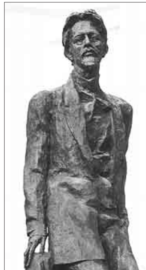
- Вишневый сад вырубил, теперь и до языка добрались...