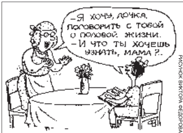
РИСУНОК ВИКТОРА ФЕДОРОВА