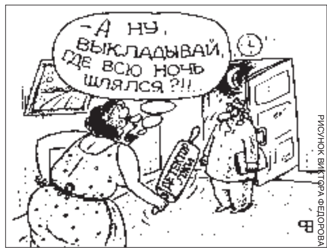
РИСУНОК ВИКТОРА ФЕДОРОВА