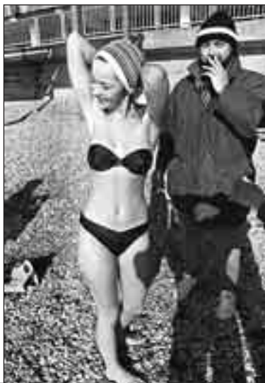
Мороз и солнце? «Солнце!» - всем своим видом утверждает Ольга Кабо.

Многие из них пришли на открытие выставки. Обретя зрелость, они выглядели такими же молодыми, как на фотографиях, сделанных в прошлом веке. Их встреча с прошлым была трогательной. Вспомина-