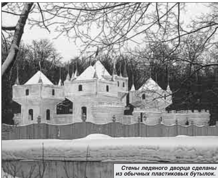
Стены ледяного дворца сделаны из обычных пластиковых бутылок.