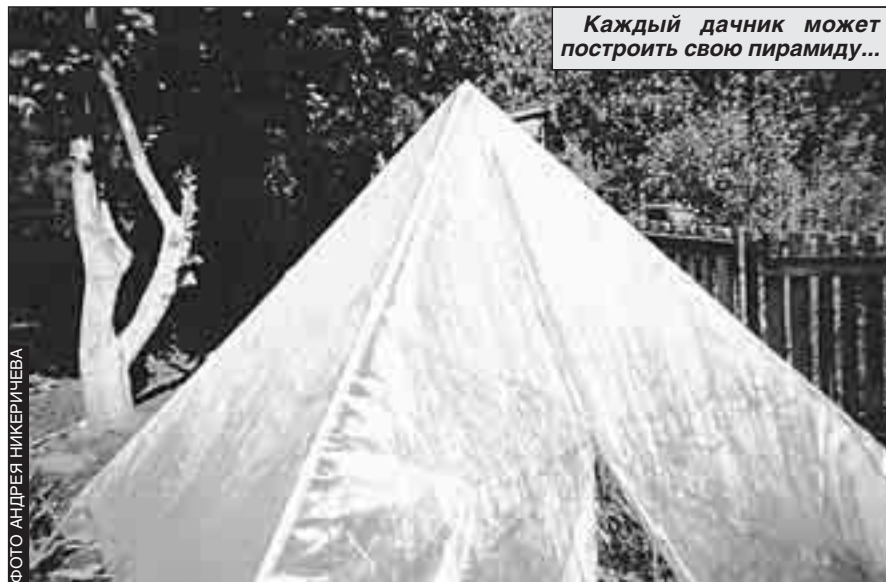
Каждый дачник может построить свою пирамиду...

ния почвы - внести повышенное количество перегноя: по 30 кг на квадратный метр и по 100 г минеральных удобрений. Стоит, однако, обратить внимание и на конструкцию теплицы. Как показывает практика, лучше всего почва сохраняет свои свойства в теплицах, боковые стороны которых остеклены, а верх покрыт пленкой.