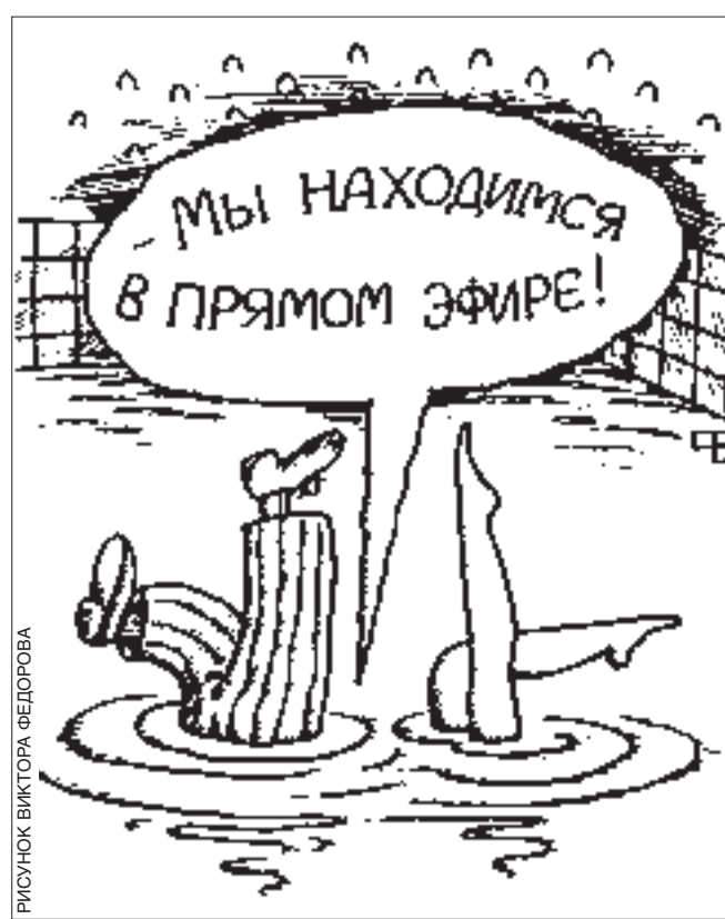
РИСУНОК ВИКТОРА ФЕДОРОВА