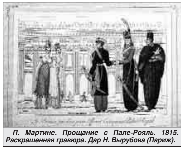
П. Мартине. Прощание с Пале-Рояль. 1815. Раскрашенная гравюра. Дар Н. Вырубова (Париж).

В последние два года значительно пополнилось наше собрание антикварных книг. Особо хочу отметить редкое издание «Опасного соседа» В.Л. Пушкина середины XIX века.