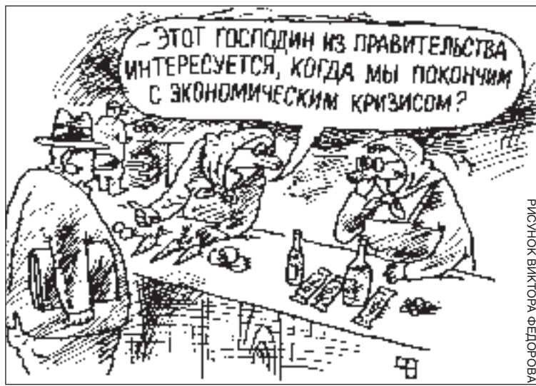
РИСУНОК ВИКТОРА ФЕДОРОВА