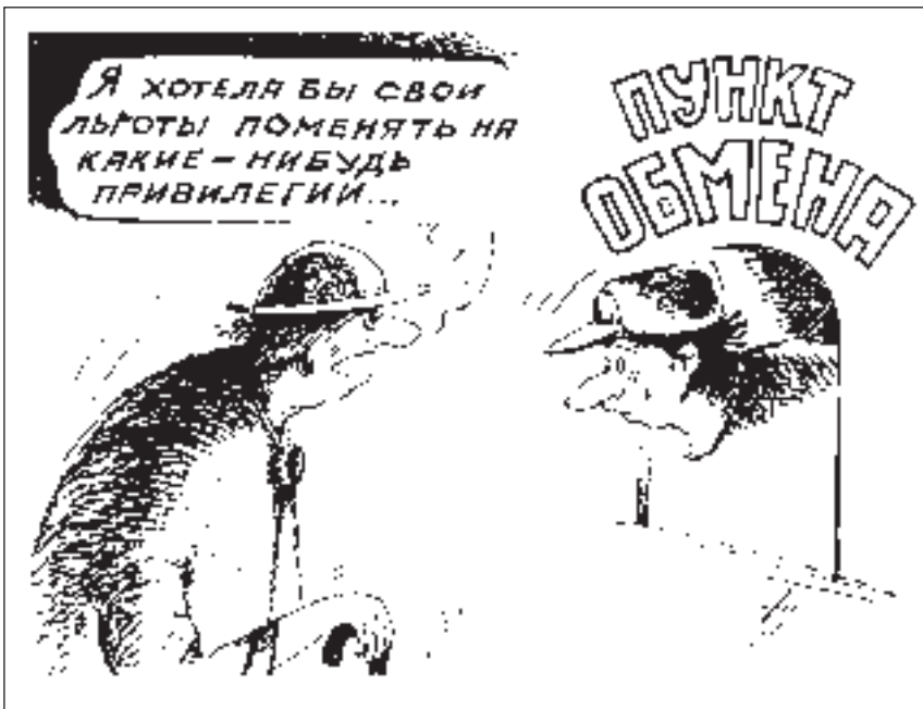
РИСУНОК АЛЕКСАНДРА ПРОХОРОВА