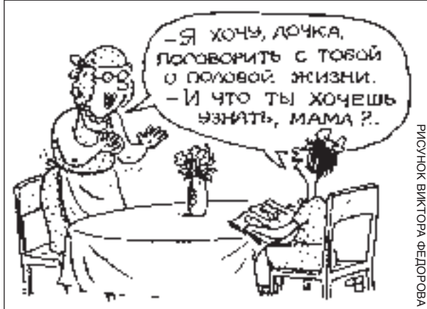
РИСУНОК ВИКТОРА ФЕДОРОВА