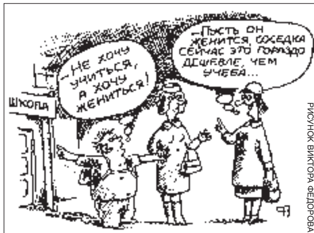
РИСУНОК ВИКТОРА ФЕДОРОВА