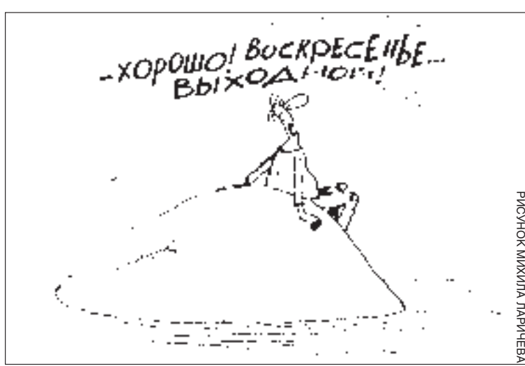
РИСУНОК МИХИЛА ДАРЧИЕВА