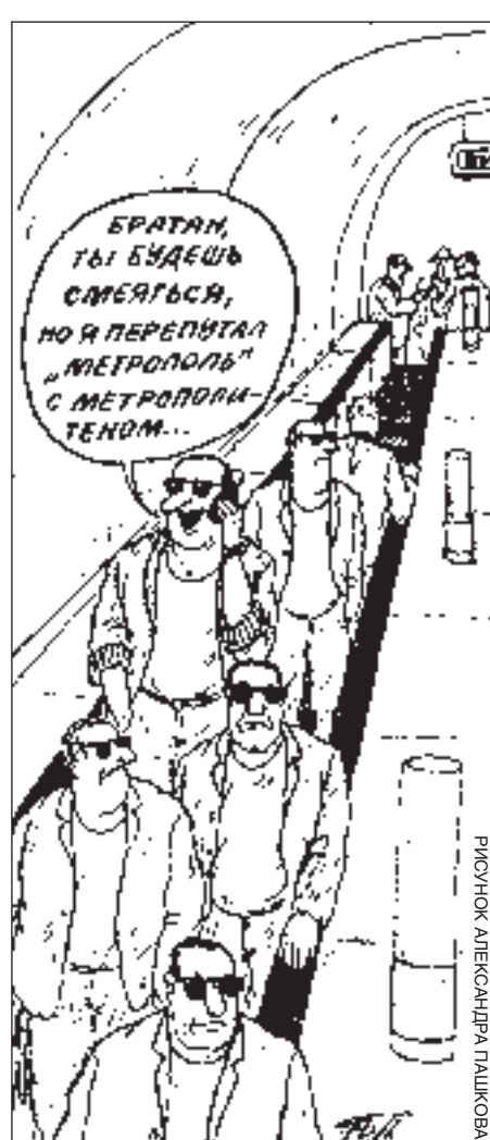
РИСУНОК АЛЕКСАНДРА ПАНКОВА