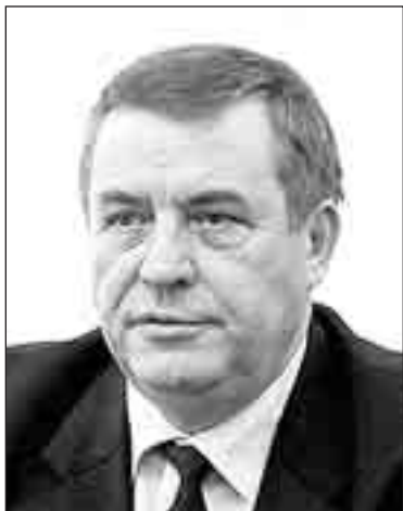
Геннадий СЕЛЕЗНЕВ, депутат Государственной думы РФ, лидер Партии Возрождения России

ное большинство регионов дотационны, зависят от федерального бюджета? Так получился тот казус, последствия которого сейчас сотрясают страну.