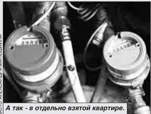
А так - в отдельно взятой квартире.