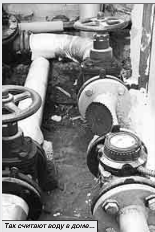
Так считают воду в доме...