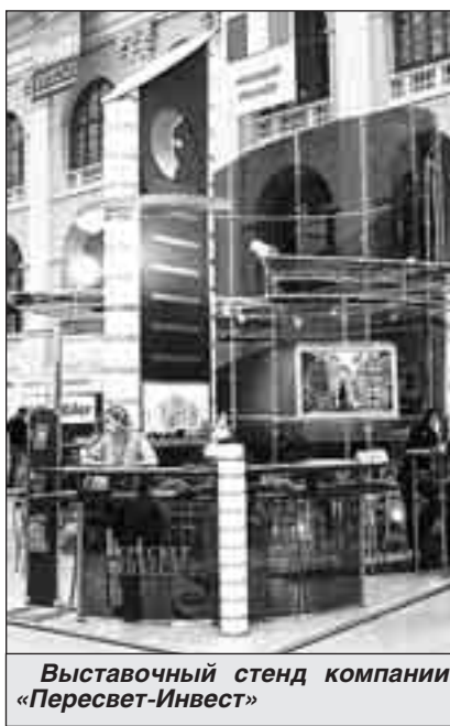
Выставочный стенд компании «Пересвет-Инвест»

Центральный офис т. 789-88-88 Отделения компании: «Пролетарское» т. 782-10-99