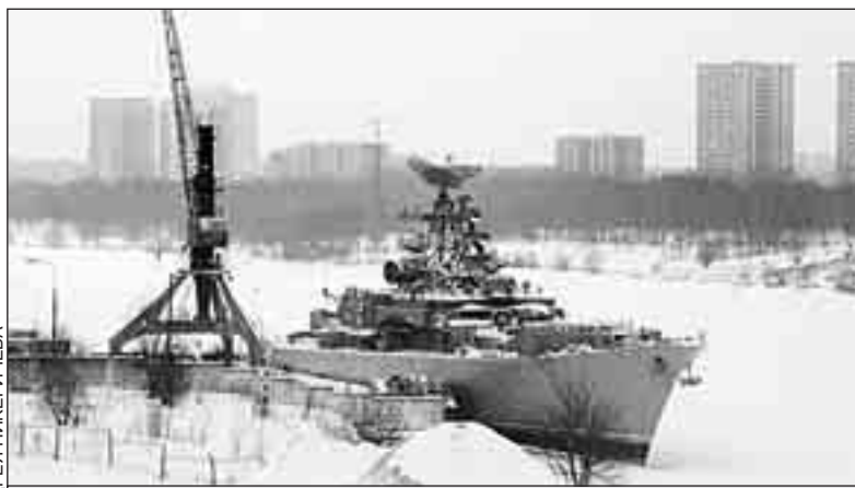
Строительная лодка «Дружный». С него и подлодки «Новосибирский комсомолец» начинается биография музейно-мемориального комплекса ВМФ.

Созданные на их базе коммерческие фирмы под названием «Музей - подводная лодка» привлекают до 1000 туристов в день, принося их владельцам миллионные доходы. Однако, по словам генерального