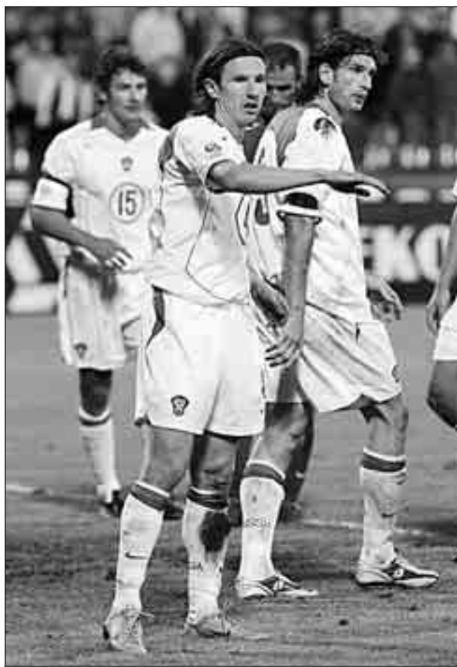
Вялая поступь сборной уже приелась болельщикам.

И вот поражение от «Химок» в чемпионате России - 66:75. Но болельщики продолжают верить в своих любимцев.