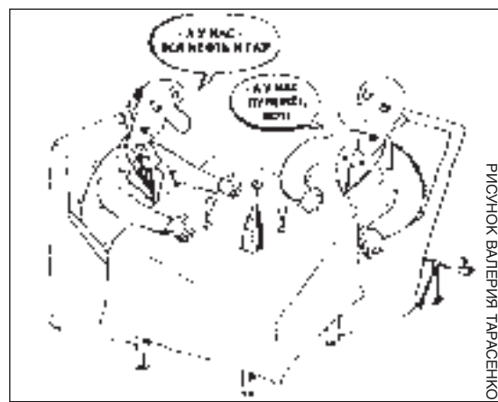
РИСУНОК ВАЛЕРИЯ ТАРАСЕНКО

Бизнес - он и в Обалдуевске бизнес. Отношение здесь к нему, как и во всем цивилизованном мире: одни клеймят, другие пользуются его благами. Не в Обалдуевске, конечно, а где-нибудь на Канарах или в любимом нашими олигархами Лондоне. Тем не менее бизнесом в смехаполисе занимаются все. И старики, и дети, не говоря уже о бизнесменах среднего возраста.