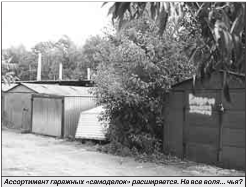
Ассортимент гаражных «самоделок» расширяется. На все воля... чья?

Однако главное все же сказано: «ракушка» эвакуирована с ведома управы. Той самой управы, которая открылась от своей причастности к этому деянию. И не случайно в сопроводительной записке к «от-