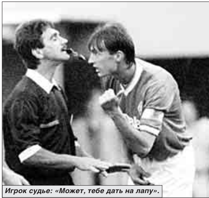
Игрок судье: «Может, тебе дать на лапу».