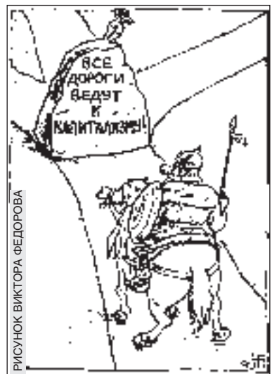
РИСУНОК ВИКТОРА ФЕДОРОВА