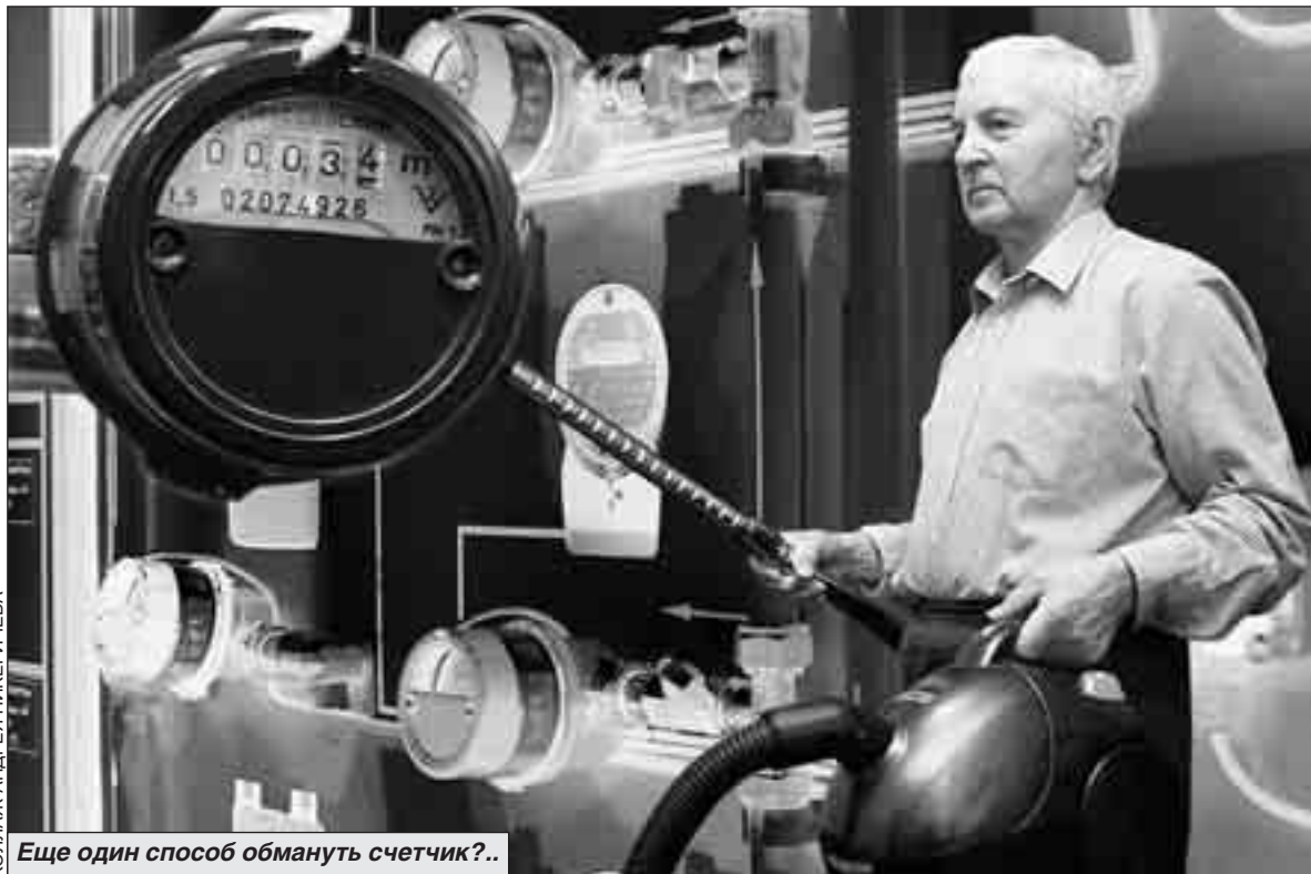
Еще один способ обмануть счетчик?..

Проходит месяц. Приносят счет. И вы не верите глазам: сумма не только не уменьшилась, но значительно увеличилась! Проводите собственное расследование и... по новому осмысливаете то, чему раньше не придавали значения. Например, тому, что в вашей квартире живут двое, но платить-то надо за троих зарегистрированных. И тому, что в квартире слева зарегистрирован один, но сдает жилье семье из пяти чело-