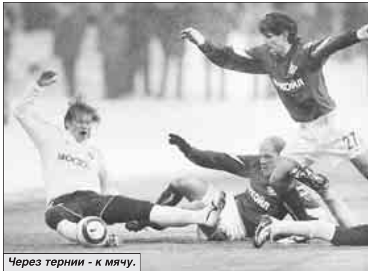
Через тернии - к мячу.

10 апреля: ЦСКА - «Крылья Советов», «Амкар» - «Москва», «Ростов» - «Спартак», «Алания» - «Шинник», «Терек» - «Торпедо», «Томь» - «Зенит».