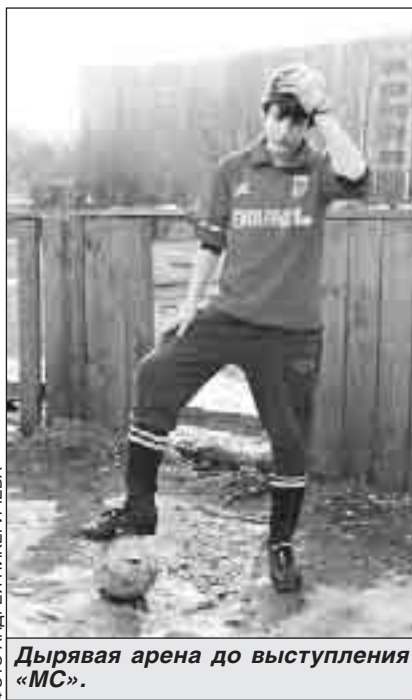
Дырявая арена до выступления «МС».

- После вашей публикации мы объездили все площадки на своей