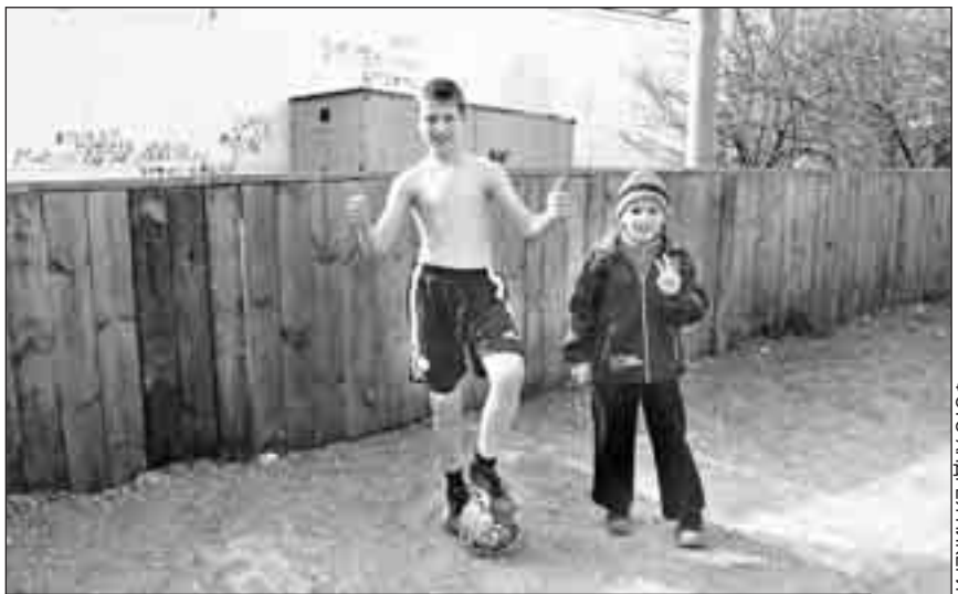
Мальчишки ликуют: теперь мяч не будет вываливаться за бортик.