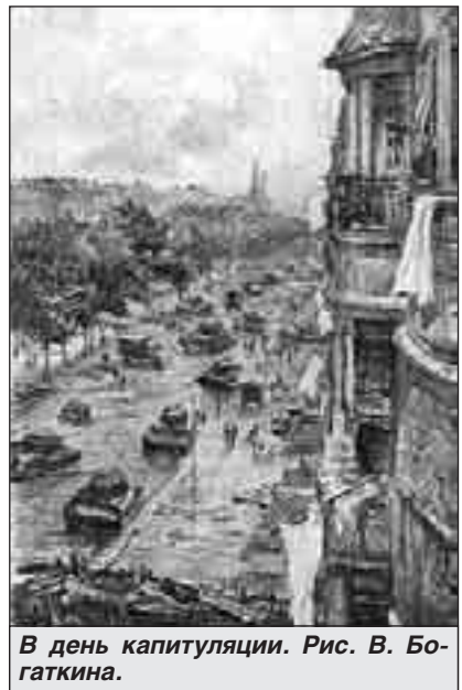
В день капитуляции. Рис. В. Богаткина.

■ «До того как мы увидели рейхстаг, батальон получил приказ - наступать