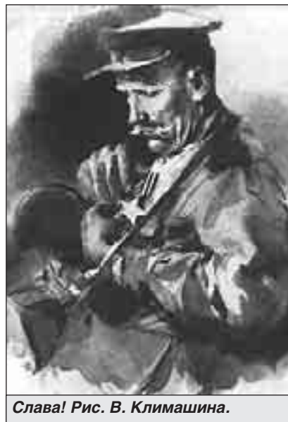
Слава!