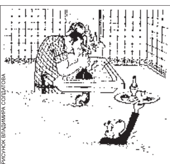
РИСУНОК ВЛАДИМИРА СОЛДАТОВА

Дачник Иванов держит в дачном сарае 1 шланг для полива, 3 лопаты и 100 килограммов навоза, а дачник Сидоров в своей сараюшке - 1 футбольную команду, 3 своры борзых и 100 человек обслуги.