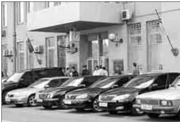
Стоимости машин, которыми пользуются чиновники энергетики, с лихвой хватило бы на модернизацию подстанции в Чагино.