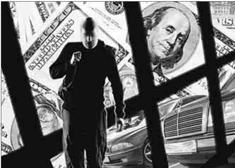
КОЛЛАЖ АЛЕКСАНДРА МАТЮШКИНА

К тому времени банда уже полностью сформировалась, - рассказывает следователь по особо важным делам прокуратуры Южного админист-