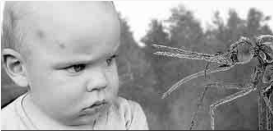
КОЛЛАЖ АЛЕКСАНДРА МАТЮШИНА

Комары, пчелы, клещи, змеи... Эти существа способны доставить летом массу неудобств. А могут не доставить, если соблюдать определенные правила.