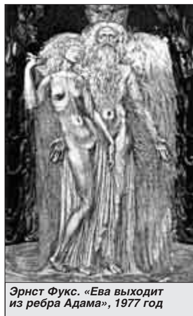
Эрнст Фукс. «Ева выходит из ребра Адама», 1977 год

военной службы, ни гонений. Внешняя канва его жизни безоблачна и благополучна. Драматизм Дали черпал в феномене фрейдизма, для которого краеугольным камнем, как известно, являлись сексуальные переживания. Именно эта сторона