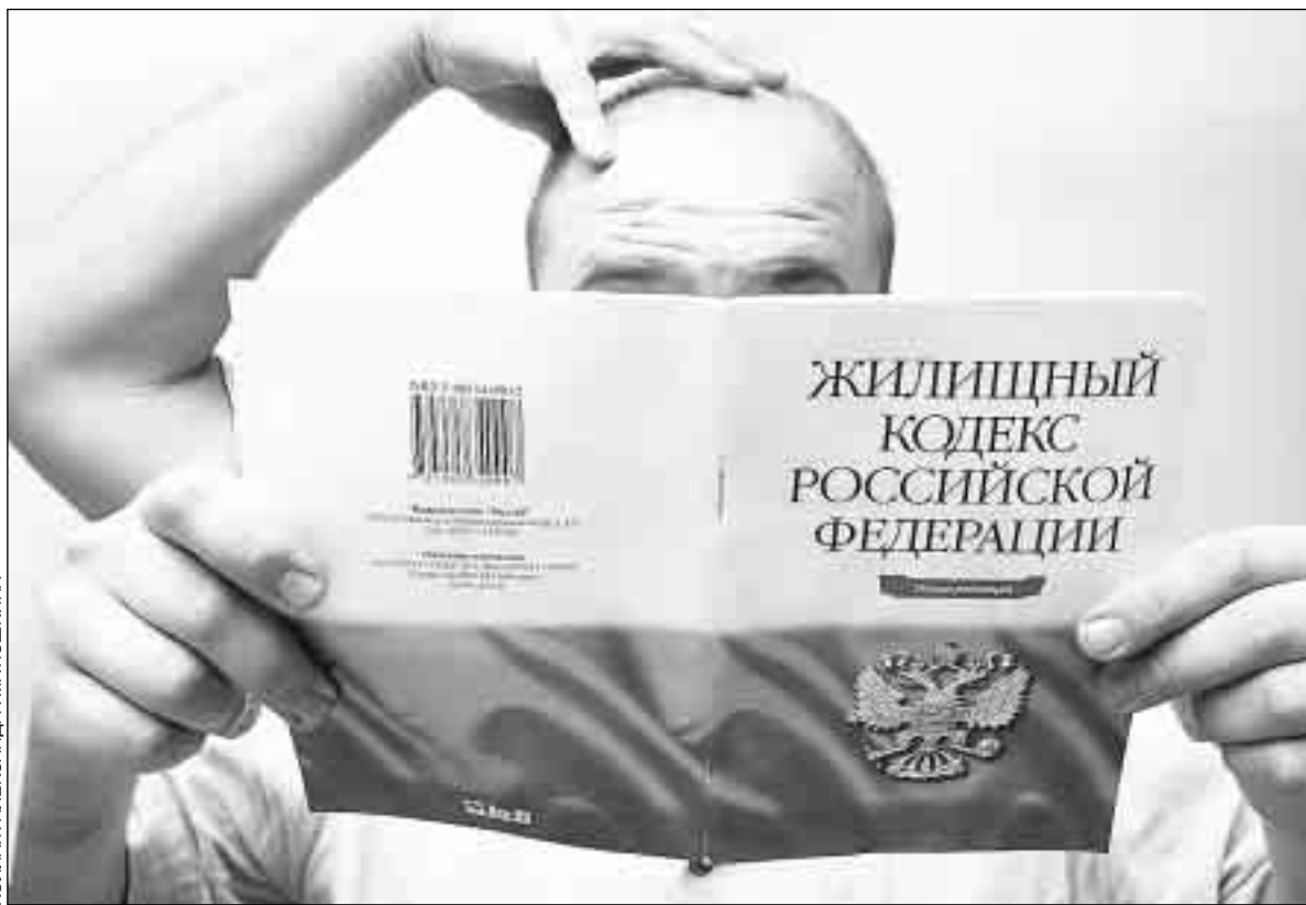
КОЛЛАЖ АЛЕКСАНДРА МАТЮШКИНА

- Субсидии предоставляются исходя из стандартов, устанавливаемых регионами, а не муниципалитетами. Регион должен профинансировать полностью все затраты муниципалитета на предоставление субсидий. Эти средства перечисляются в местный бюджет, а из него предоставляются людям. То есть муниципалитет свои средства не обязан тратить. Если муниципалитет имеет возможность доплачивать, он бу-