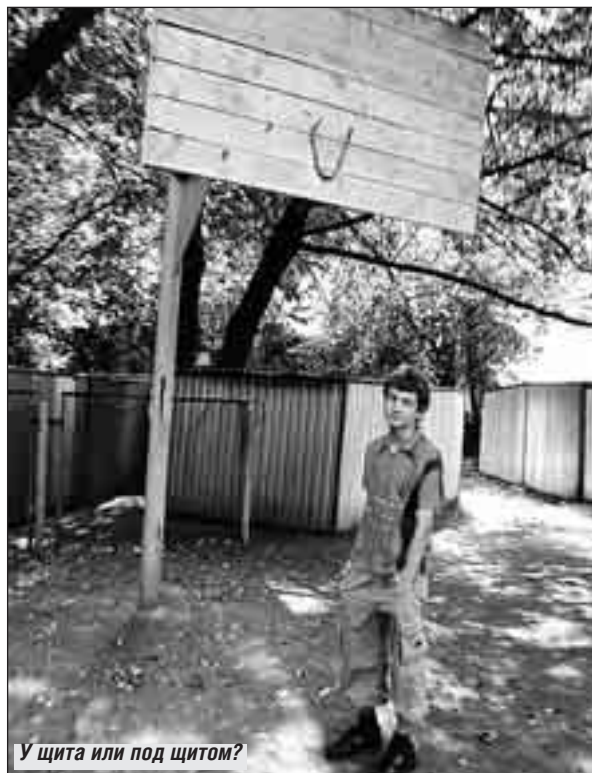
У щита или под щитом?