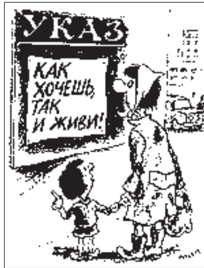
РИСУНОК ВЛАДИМИРА МИЛЕЙКО

Семен Семенович Лягушкин негодовал. Это же надо, что удумали: брать в центре города деньги за парковку! Еще вчера ставил свою старенькую «копейку», где хотел, а теперь - плати!