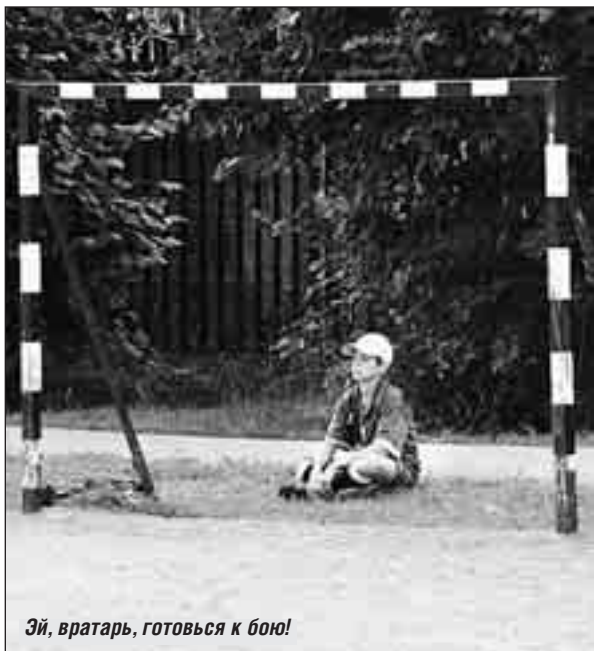
Эй, вратарь, готовься к бою!

Подростки во дворах Выхина-Жулеби-на, что на Юго-Востоке столицы, слонялись без дела.