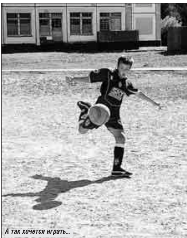
А так хочется играть...

Ферганской улице и у дома № 11, корпус 1 наткнулись на еще одну прямо-таки «уникальную» площадку. Кольца на баскетбольных щитах почти новенькие, правда, без сеток. Арена с претензиями на универсальность: кроме баскетбола, можно, наверное, и в