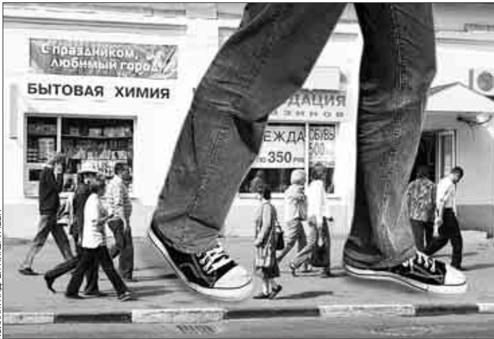
КОллаж АНДРЕЯ НИКЕРИЧЕВА

пример, мыльной оперой или солями. Они — настоящие материалисты и часто эгоисты»; «В подавляющем большинстве случаев цинизм — не более чем маска. Хорошие люди под ней оказываются, с душами тонкими и ранимыми. Просто в такие души все норовят войти в нечищенные сапогах, потоптаться, на пол плюнуть... Вот и приходится таким способом защищаться. Так что цинизм не так уж плох».