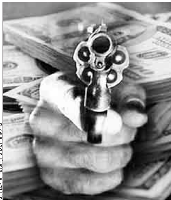
КОЛЛАЖ АЛЕКСАНДРА МАТКОШКИНА

Все началось с пустяка. Свинцов залез в долги. Чтобы выкрутиться, он решил перехватить деньги на стороне. Старый приятель Прохоров, с которым они когда-то вместе начинали, не отказал в кредите. Пообещав быстро вернуть деньги, Свинцов прогадал. Дело не заладилось, он еще больше залез в долги.