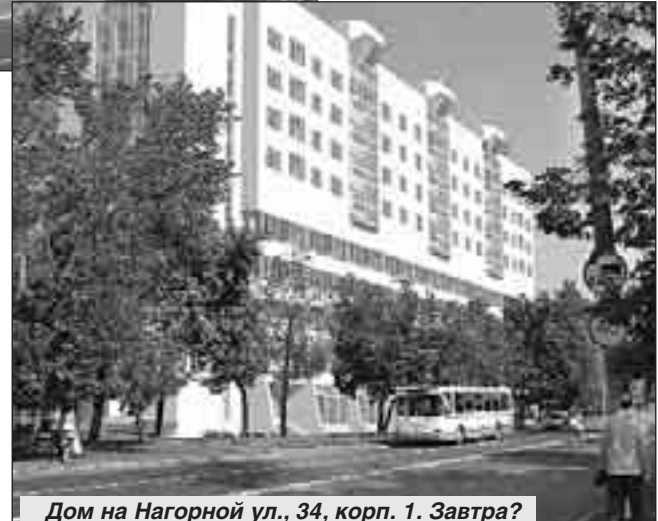
Дом на Нагорной ул., 34, корп. 1. Завтра?