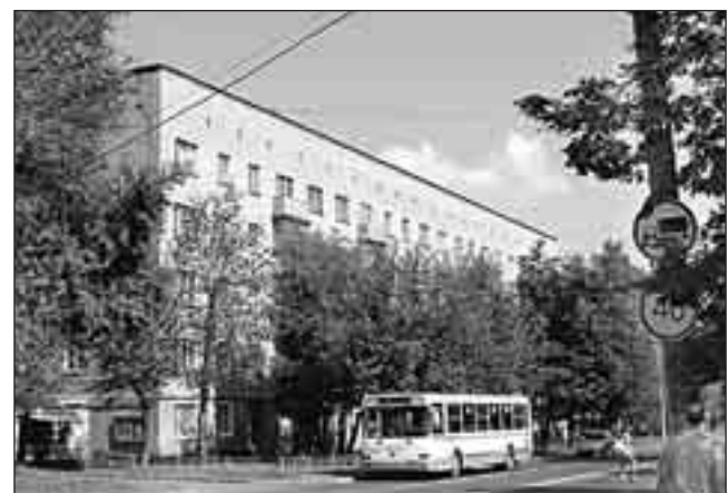
Дом на Нагорной ул., 34, корп. 1 – сегодня

– Существует специальная технология, опробованная уже в Германии и Финляндии, – отвечает Клеев. – Нынешний фундамент мы даже не затронем – верхние четыре этажа будут держаться на колоннах, на них ляжет и эксплуатируемая кровля, где