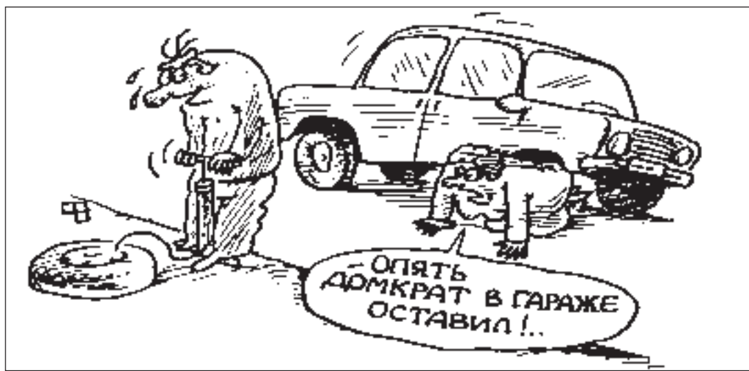
РИСУНОК ВИКТОРА ФЕДОРОВА